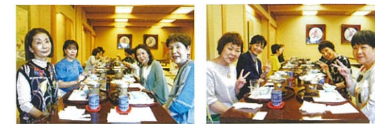
▲伝統の京懐石料理をゆったりと流れる時間の中で