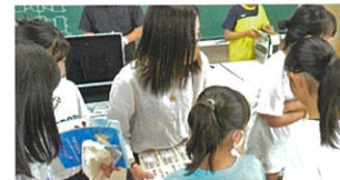
▲7/10 名張市立梅が丘小学校