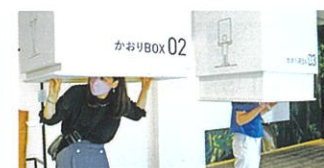
▲香りで満たされたBOXへ