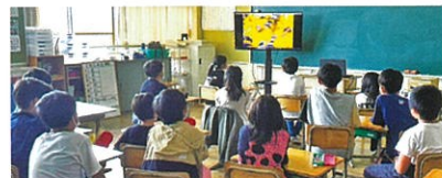
▲6/15 伊賀市立西柘植小学校