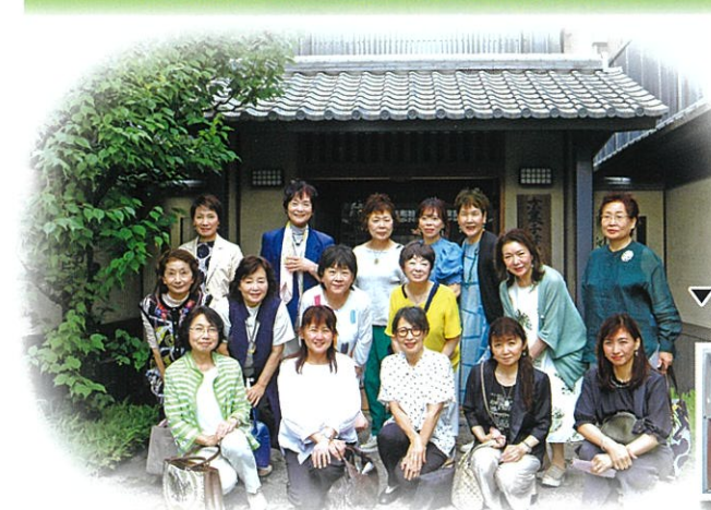
▽よひら(紫陽花)を2種類制作