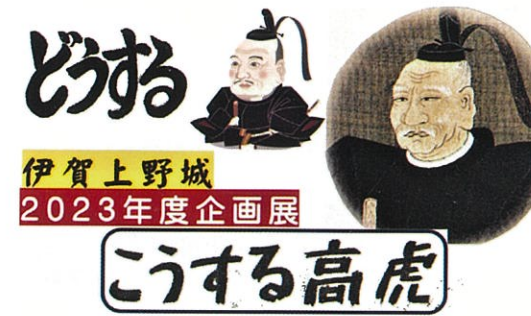
▲「どうする家康・こうする高虎!!」展 令和5年12月24日(日)まで開催中!

また、天守閣の“米寿記念”企画として、「私の伊賀上野城」のテーマでエッセイを募集したところ、四十二編のご応募があり過半数が米国を含む市外、県外からでした。