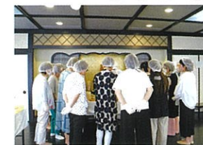
▲職人さんに教えていただきながら、京菓子作りを体験