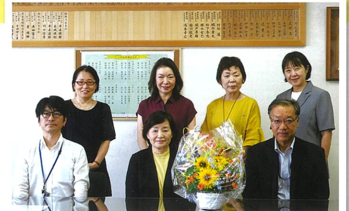
【聞き手】女性部会 総務委員会