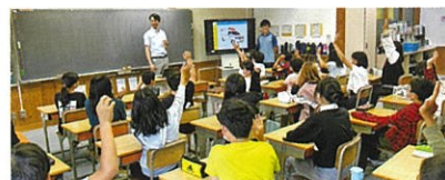
▲6/7 伊賀市立久米小学校

このほか、伊賀市立上野北小学校、伊賀市立大山田小学校、伊賀市立壬生野小学校、伊賀市立島ヶ原小学校、伊賀市立柘植小学校、伊賀市立府中小学校、名張市立比奈知小学校でも開催いたしました！