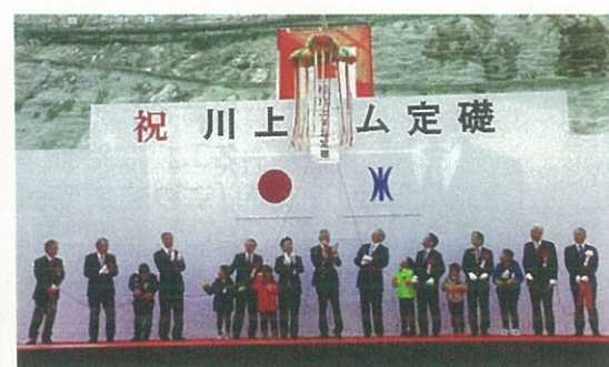
▲令和元年12月15日の定礎式の様子。