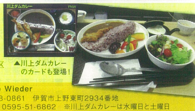
▲川上ダムカレーのカードも登場!

ダムを表現したライスには古代米を、ルーには地場産のブルーベリーを使用するこだわりの逸品。ダム見学後は是非ご賞味ください!