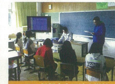
1/22 伊賀市立玉滝小学校