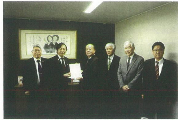
令和元年11月11日 ▲伊賀市長・副市長 ▼伊賀市議会議員・副議長