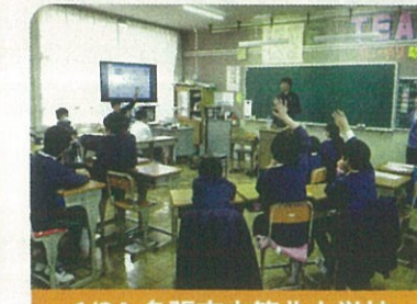
1/24 名張市立箕曲小学校

このほか、伊賀市立成和東小学校、名張市立名張小学校、伊賀市立上野東小学校、伊賀市立長田小学校、伊賀市立西柘植小学校、伊賀市立青山小学校、名張市立錦生赤目小学校、伊賀市立神戸小学校、名張市立百合が丘小学校でも開催いたしました！