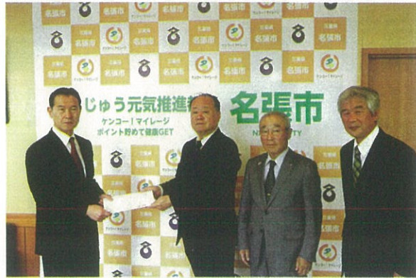
令和元年10月30日 ▲名張市長 ▼名張市議会議員