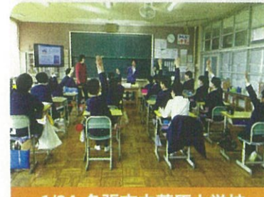
1/24 名張市立薦原小学校