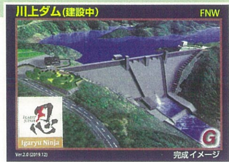
▲完成予想図。「ダムカード」として配布され、コレクターなどから人気を集めている。

緑深く豊かな水源と強固な地盤に恵まれた伊賀市旧青山地区。周辺には、青山高原ウィンドファームや青山ハーモニーフォレストなど、自然を生かした観光施設も点在しています。この川上地区一帯で建設が進められている川上ダムは、重力式コンクリートダムで、堤高84m、完成すれば木津川流域のダムの中では最も堤高の高いダムとなります。