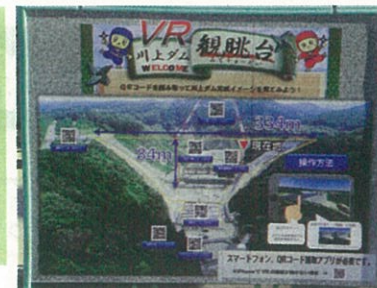
◀「観眺台」から見える建設現場。大人でも興奮するほど壮大な建設現場だ。

【開放時間8:30~16:30(年末年始を除く) ただし、情報館は日曜・祝日のみ閉館】