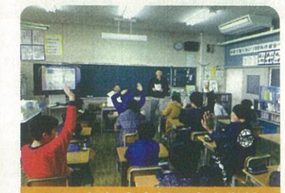
1/23 伊賀市立依那古小学校