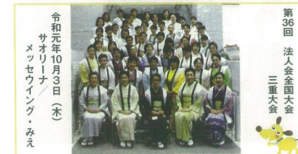
令和元年10月3日(木) サオリーナ/メッセウイング・みえ