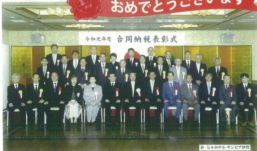
令和元年度 合同納税表彰式 令和元年11月13日