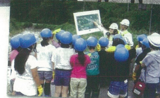
▲地元の小学生たちの社会見学にも人気。また、川上ダムについて広く知っていただくため出前講座も実施しています。