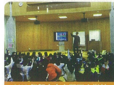
1/10 伊賀市立上野西小学校

学校や公立図書館など、さまざまな場所や場面で活用されている税金について、工夫を凝らした授業を行いました。児童の皆さんにも税金が身近なものであって、私たちの暮らしがより豊かになるように大切に活用していかなければならないものであることをお伝えし、楽しみながら理解を深めていただいています。