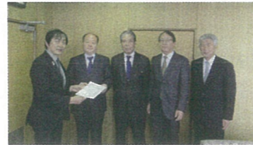
平成30年11月8日、14日 ▲伊賀市長 ▼伊賀市議会議長