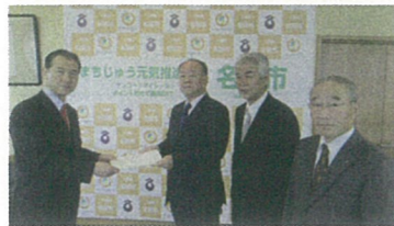
平成30年11月8日 ▲名張市長 ▼名張市議会議長